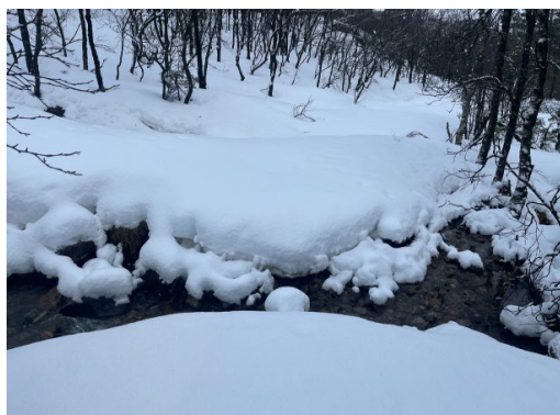
Bekk over trasé = umogeleg å laga løype.