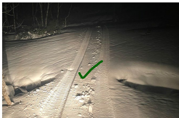
Bru over bekk = suksess.